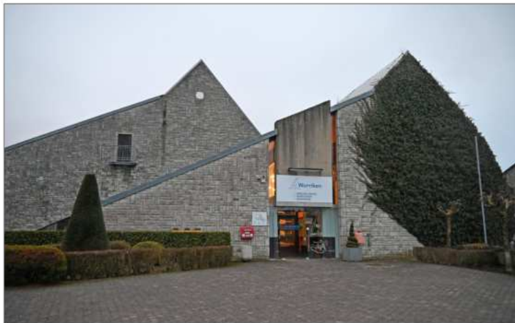
Der Sport- und Ferienpark Worriken bietet optimale Voraussetzungen für eine große Breitensportveranstaltung wie die IVV-Europiade, die erstmals in Ostbelgien stattfindet.